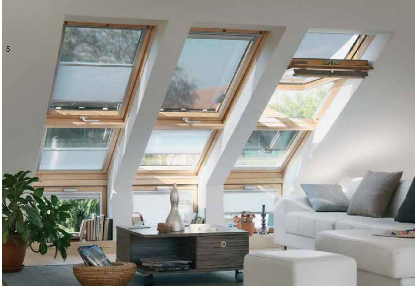
5. Vertikalni elementi u kombinaciji sa klasičnim krovnim prozorima idealno su rešenje za krovne nagibe kako bi bilo iskorišćeno kompletno potkrovlje, VELUX.