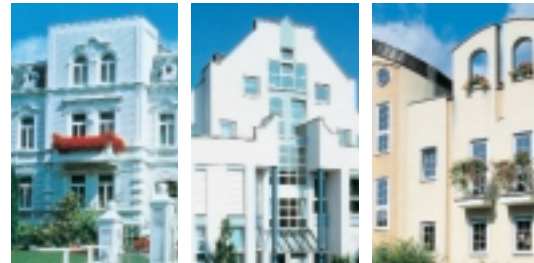
klasično – upečatljivo – dinamično primeri raznovrsnog dizajna VEKA sistema

Svaki dan oblikujemo naš životni prostor manje više svesno ili nesvesno. Na primer kada uređujemo stan ili kada jednostavno u kancelariji okačimo kalendar ili iznova uredimo svoj pisači sto. Mi i sebe »dizajniramo« svaki put iznova. Koju ću jaknu danas obući? Da li se džemper slaže sa čarapama? Da li mi se još uvek sviđa moja frizura? Stalno donosimo odluke o oblicima i bojama, pravimo izbor i radimo na svom sasvim ličnom životnom stilu.